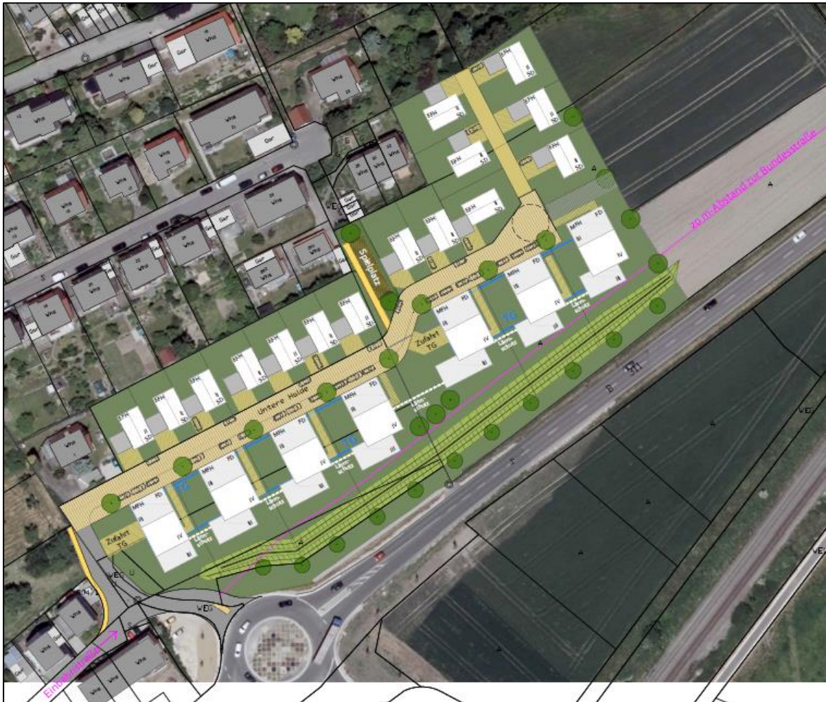
Abb. 3: Städtebaulicher Entwurf, Stand 5.5.2020. Plan: Stemshorn Kopp (Ausschnitt)